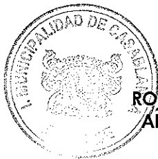
RODRIGO MARTINEZ ROCA Alcalde de Casablanca