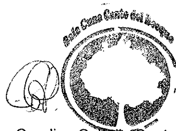
Carolina Cabello Contreras

Por todo lo anterior sugiero su contratación para el periodo que continua.